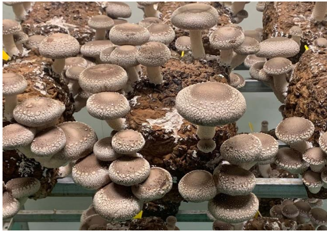
*当社90日培養（チップ50%）