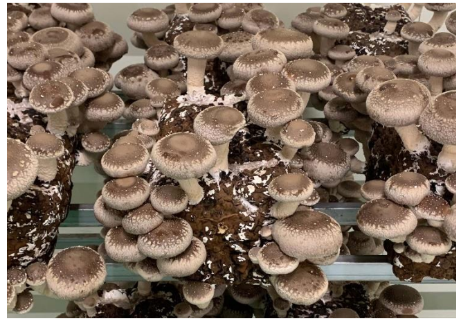
*当社104日培養（チップ50%）